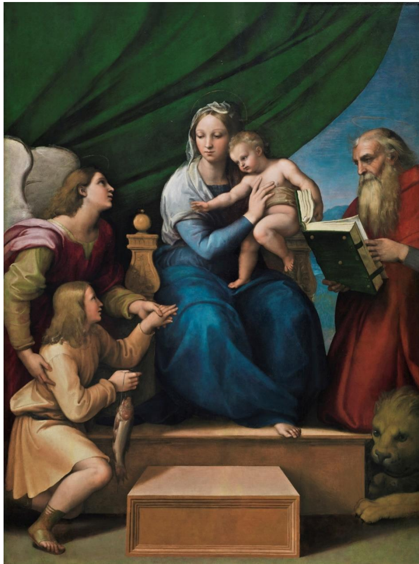
«Мадонна с рыбой»

И это совершенство было им достигнуто. «Сикстинская Мадонна» (1515 – 1519) – великий шедевр Рафаэля, самая знаменитая его картина. Мария идет по облакам, неся своего ребенка. Папа Сикст IV, преклонив колени, созерцает чудесное явление; святая Варвара благоговейно потупила взор, а два ангелочка у нижнего края картины устремляют вверх задумчивые взгляды. Тяжелые зеленые занавеси обрамляют чудо явления небесной царицы, несущей людям своего сына как искупительную жертву.