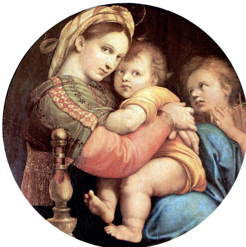
«Мадонна в кресле»

В Риме Рафаэль снова обратился к излюбленному им образу Мадонны. Однако теперь он приобретает в его творчестве новые черты. Его флорентийские Мадонны – это очаровательные, трогательные и юные матери; римские же – величественные и женственные, исполненные благородства и особой одухотворенной гармонии небесные владычицы. «Мадонна в кресле», «Мадонна с рыбой», «Мадонна дель Фолиньо» знаменуют новые искания художника на его пути к совершенству в воплощении идеального образа.