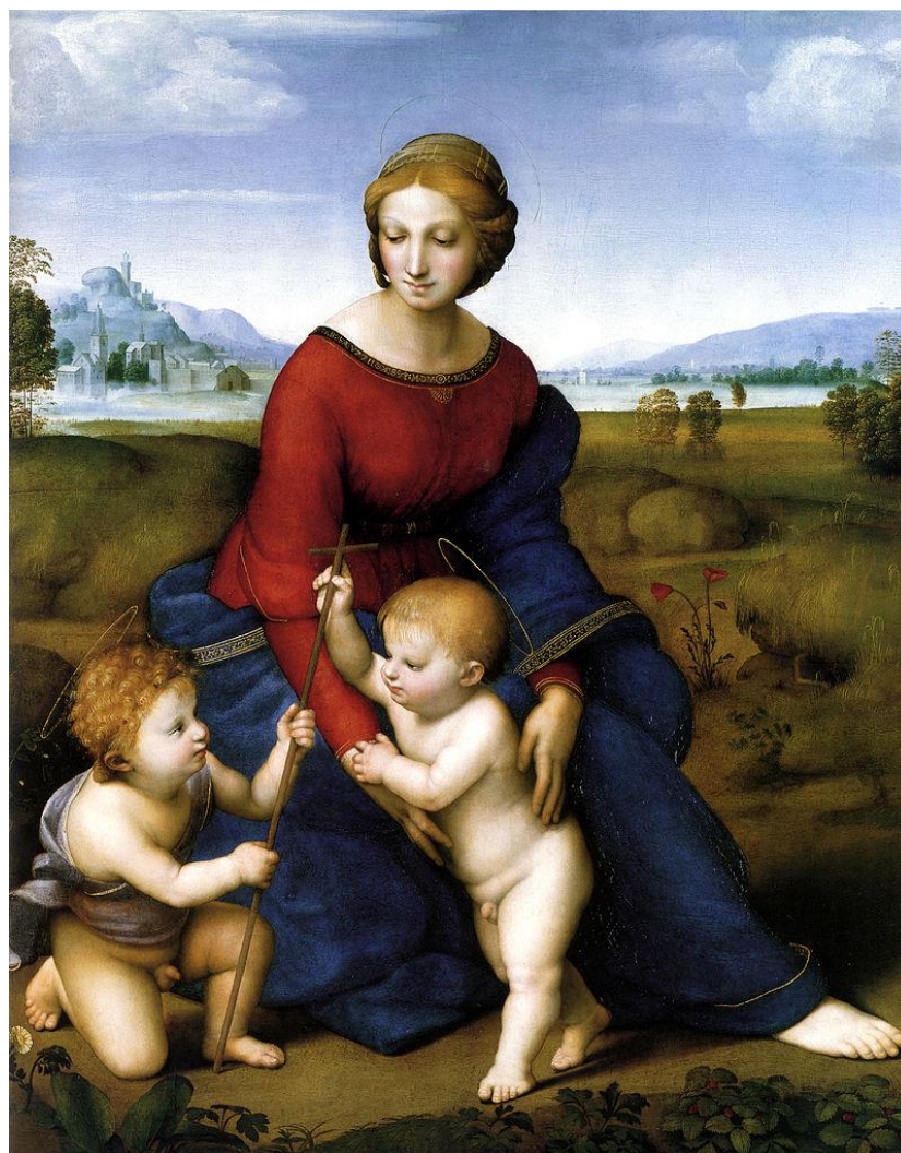
«Мадонна в зелени»

Флорентийский период творчества Рафаэля длился с 1504 г. по 1508 г. К этому периоду относятся такие прекрасные произведения как «Мадонна в зелени» и «Мадонна со щегленком» .